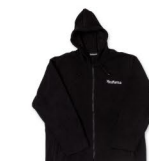
NOVINKA MIKINA s kapucí Velikost: S-4XL 100 bodů