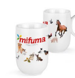
HRNEK 17 bodů