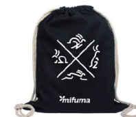
NOVINKA BATOH "KVARTET" bavlna 10 bodů