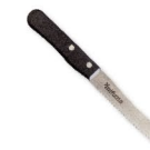
NOŽ - PILKA 45 bodů