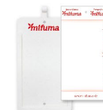
DRŽÁK OCEŇOVAČÍCH LÍSTKŮ 15 ks papírový nebo 2 ks plastový 8 bodů