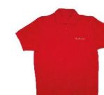
TRIKO bavlna Velikost: S-XXL 30 bodů