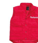
VESTA Velikost: S-4XL 120 bodů