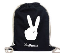
NOVINKA BATOH KRÁLÍK "V" bavlna 10 bodů