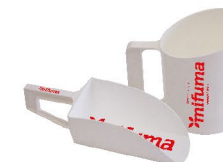
LOPATKA NEBO ODMĚRKA NA KRMIVO 5 bodů každá