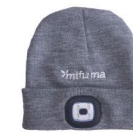
LED-ČEPICE nastavitelná intenzita, dobíjecí 60 bodů